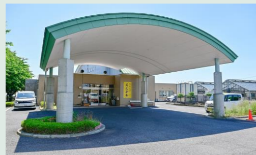
利用定員（1日：30名） リハビリのみの短時間利用対応可 ※応相談