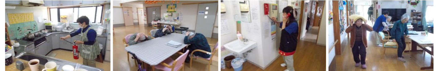
グループホームとんぼ：非常災害訓練の様子

4月9日(木)、介護付き有料老人ホームほかほかライフ、グループホームとんぼ、グループホームめだかでは、地震・火災想定非常災害避難訓練を実施しました。また、4月21日(火)、グループホームうさぎ、居宅介護支援事業所あいあいでは、日中火災想定避難訓練を実施しました。皆様焦ることなく職員の指示に従い、安全に避難することができました。入所者様お一人おひとりの安全と安心を守るため、今後も職員一同が連携し、地域とともに防災意識の向上に努めてまいります。