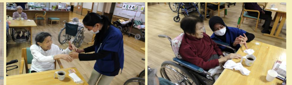
入所者様とコミュニケーションをとりながら、業務に取り組んでいます。