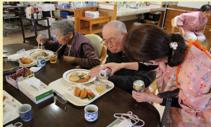
「ノンアルコールビールのお替わりいかがですか？」

ノンアルコールビールなどのソフトドリンクで賑やかに「カンパ〜イ！」 本日のメニューは前日から煮込んだ染み染みの愛情たっぷりおでんと稲荷寿司です。