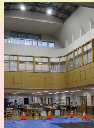
天窓が高く開放的な一般棟フロア 照明器具をLEDに交換