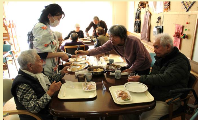
「おでんもっと食べて〜」