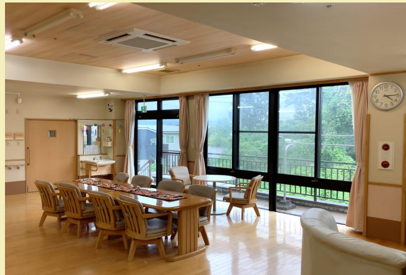
△食堂兼機能訓練室

全室個室、定員22名のアットホームな施設です。 ひとりの時間を大切にしたい方、皆様と賑やかに過ごしたい方、機能訓練を頑張りたい方など、介護・看護経験豊富なスタッフが一人おひとりのライフスタイルや思いに寄り添ったサポートを心掛けています。施設内には併設のデイサービスがあり、利用者様との交流も盛んです。入居後もご友人やご家族との関係もそのまま続けられ、豊かな日々をお過ごしいただけるようサポートいたします。