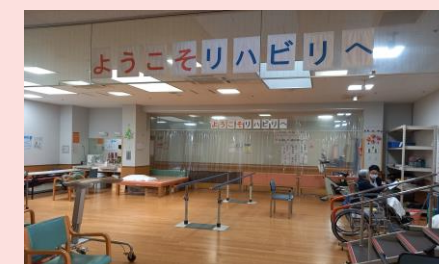
ケアピース正面玄関より廊下を東側のリハビリ室が多床室2室へ