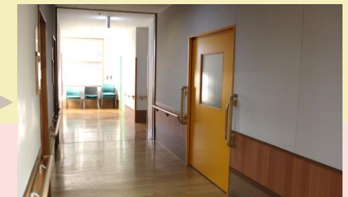
正面玄関よりすぐの多床室