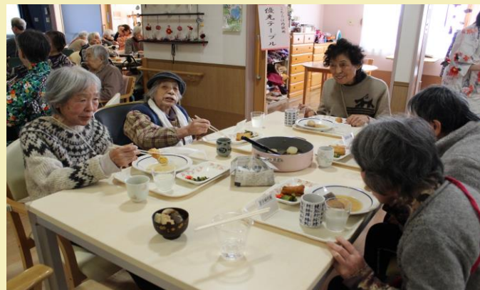
「おでんは味が染みてて美味しいね〜」「大根のお替わりくださ〜い！」賑やかな声がたくさん聞かれました。