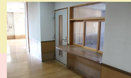
ケアピース正面玄関より右手の施設長室が多床室と診察室へ