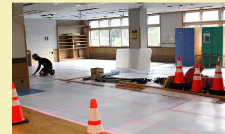
ケアピース正面玄関より左手の通所リハビリフロアが多床室2室へ