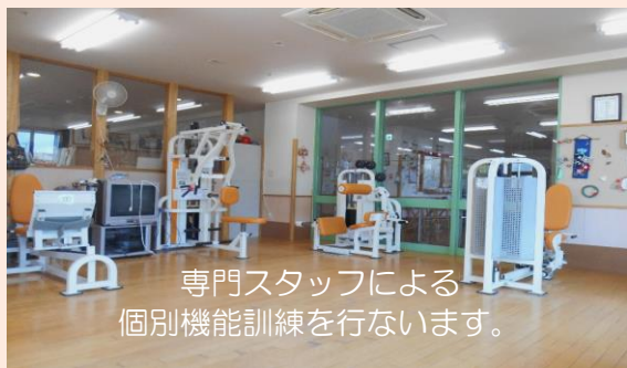
専門スタッフによる 個別機能訓練を行ないます。