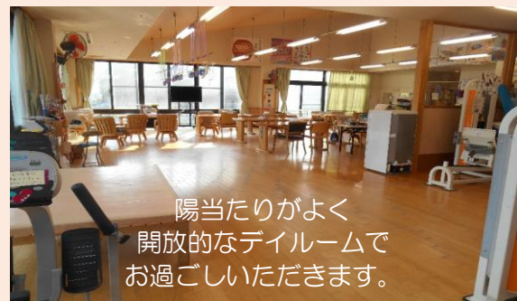
陽当たりがよく 開放的なダイニングで お過ごしいたできます。