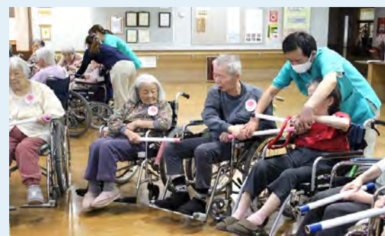
輪っか通しリレー