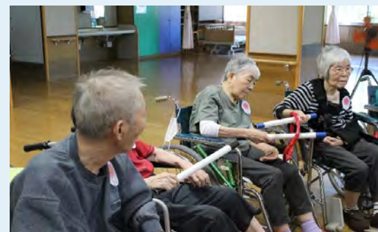
輪っか通しリレー