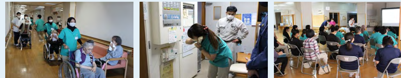
非常災害訓練の様子

BCPとは Business Continuity Plan の略称で、業務継続計画と訳されます。 新型コロナウイルス等の感染症や大地震などの災害が発生すると、通常通りに業務を実施することが困難になります。まず、業務を中断させないように準備するとともに、中断した場合でも優先業務を実施するため、あらかじめ検討した方針、体制、手順等を示した計画のことです。 令和6年度の介護報酬改定により、BCPの策定が義務付けられました。