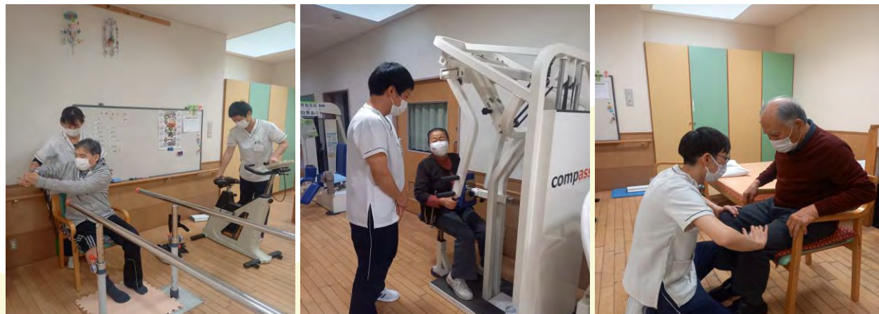
理学療法士による個別リハビリ