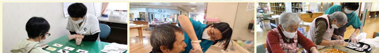
言語聴覚士による 言語・摂食・嚥下機能リハビリ