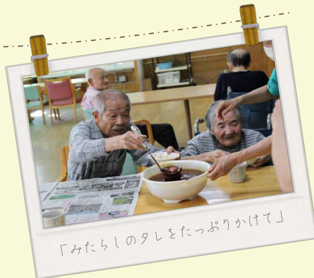
「みたらしのタレをたっぷりかけて」