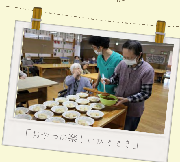
「おやつの楽しいひととき」