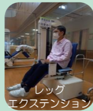
レックエクステンション