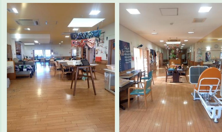
ケアピースデイ えんがわ「ダイニング」

ケアピースデイ えんがわと合わせまして、今後とも変わらぬご愛顧を賜りますよう、よろしくお願い申し上げます。