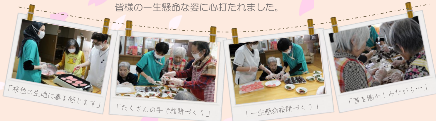
「桜色の生地に春を感じます」

専門棟では、入所者様と職員で桜餅づくりを行いました。 おやつ作りは人気のイベントのひとつです。 皆様の一生懸命な姿に心打たれました。