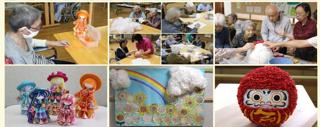
●通所リハビリテーション利用者様による『ペーパーフラワードール』 ●一般棟入所者様による『夏の思い出』 ●専門棟入所者様による『縁起だるま』

この度、群馬県老人保健施設協会広報誌『ひろば8月号』へ掲載されることとなりました。入所者様、通所リハビリテーション利用者様の作品です。