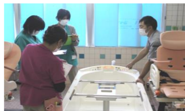
導入にあたり、職員研修を開催しました。