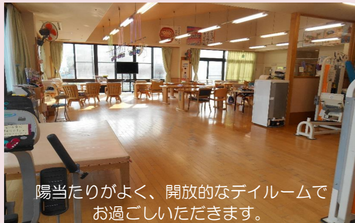
陽当たりがよく、開放的なダイニングでお過ごしいただきます。