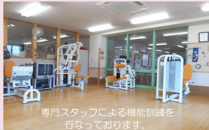
専門スタッフによる機能訓練を行っております。